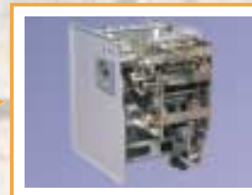
Local Notes Extractor - LNE