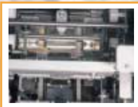
Chargement de la liasse dans la navette du RNF