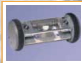
Navette chargée d'une liasse