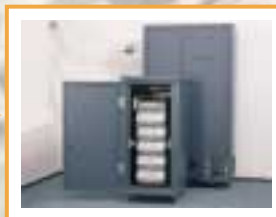
RNF avec distributeur à 4 cassettes + cassette rejet