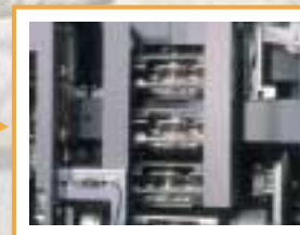
Stock de navettes dans le RNF