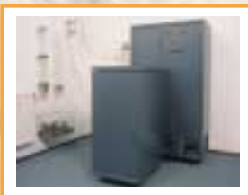
Remote Notes Feeder - RNF